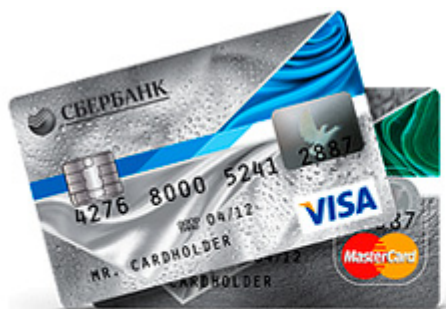
Кредитные карты Momentum