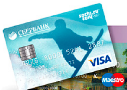
Дебетовые карты Momentum